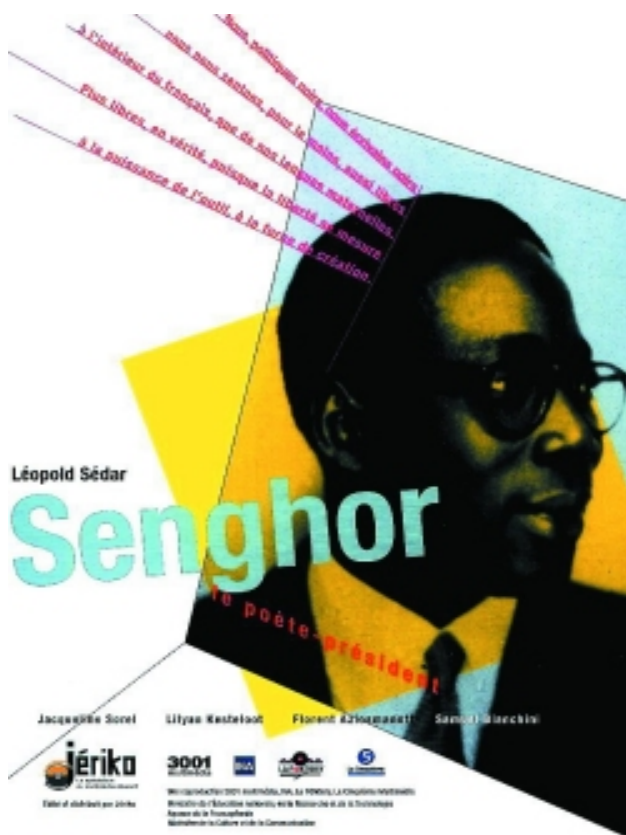
Leopold Sedar Senghor

Dans ce groupe, nous notons aussi la littérature africaine en langue portugaise par des auteurs comme Agostino Neto (premier Président de l'Angola), Pepetela, Jose Craveirinha, Luis Honwana, Jose Luandino Vieira de l'Angola. Cette littérature lusophone compte aussi des auteurs comme Baltasar Lopes du Cape Vert.